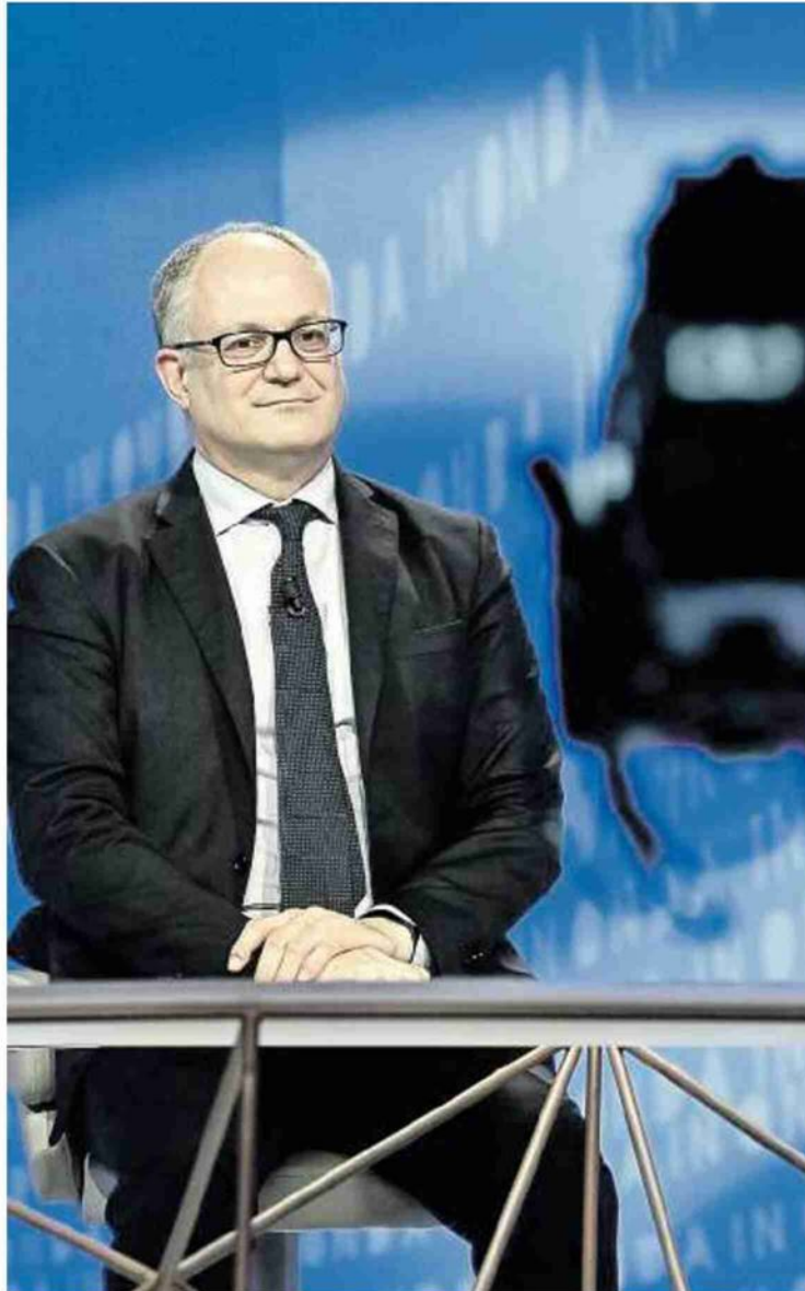
Il ministro dell'Economia Roberto Gualtieri